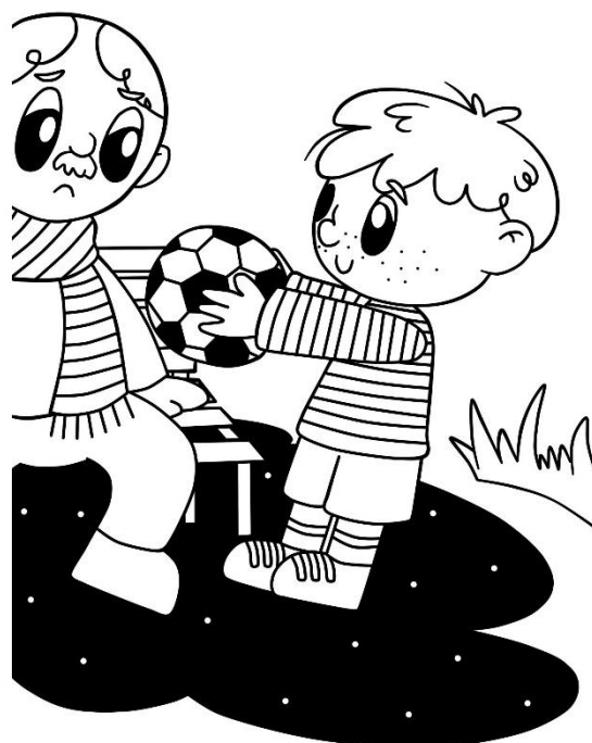
Legenda 1: Páginas do Livro de Colorir